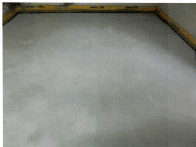
Abbildung A 2.3: Zementestrich (Prüfsituation)