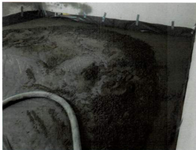
Abbildung A 2.2: Montagesituation mit Zementestrich